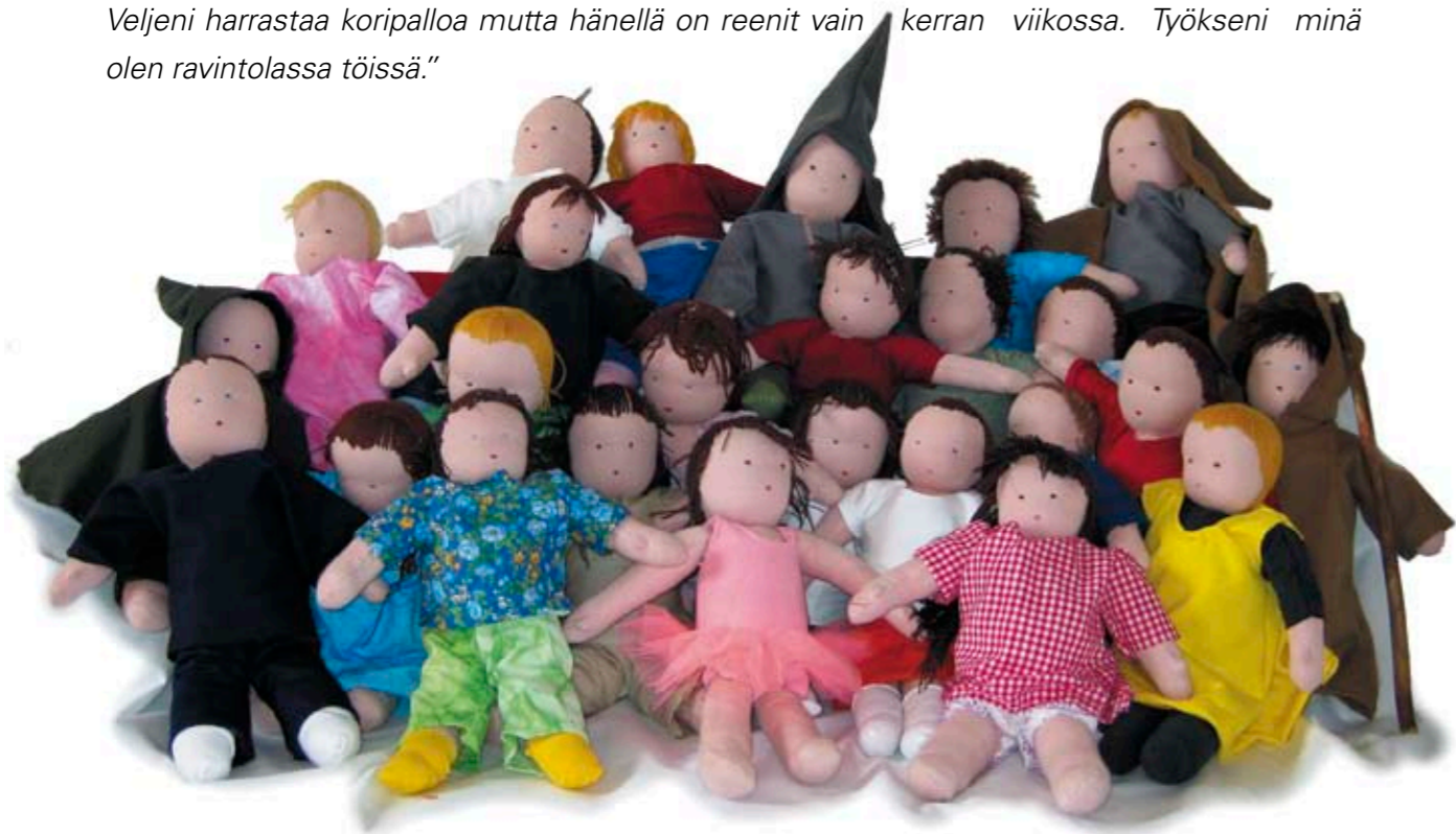
Molempien kuudensien luokkien nukkeja. Osa vaatteista ja hiuksista oli kuvaushetkellä vielä hieman kesken.

”Minun nimeni on Kalle ja minä asun Espanjassa. Minun isäni kuoli vuosi sitten autokolarisiin, mutta äitini ja veljeni Pekka asuvat Suomessa. Minä käyn harvoin heidän luonaan, koska minulla ei ole varaa lentoihin. Minä harrastan jalkapalloa ja käyn joka päivä harjoittelemassa. Veljeni harrastaa koripalloa mutta hänellä on reenit vain kerran viikossa. Työkseni minä olen ravintolassa töissä.”